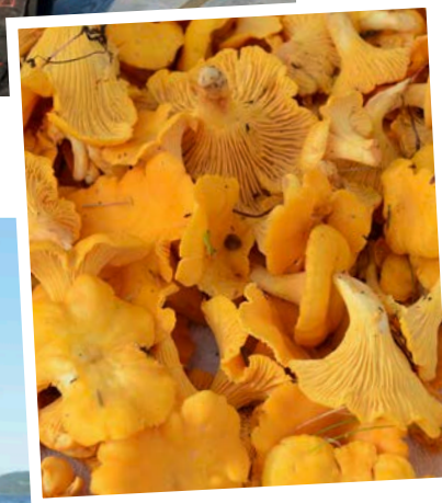
Leckere Pfifferlinge lassen sich bereits ab dem Sommeranfang finden.

Lumb obendrauf (Platz 4). Nur etwas weiter Richtung Nordosten bei Bjunga kurz hinter einer Fahrwassertonne sind über den vielen flacheren Unterwasserbergen stattliche Pollacks und schöne Tangdorsche zu bändigen. In den Rinnen dazwischen werden immer wieder Heilbutte gefangen (Platz 5).