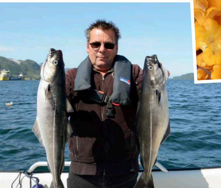
Sind die Köhler gefunden und auf Beutezug, rappelt es oft im Minutentakt an den Ruten.